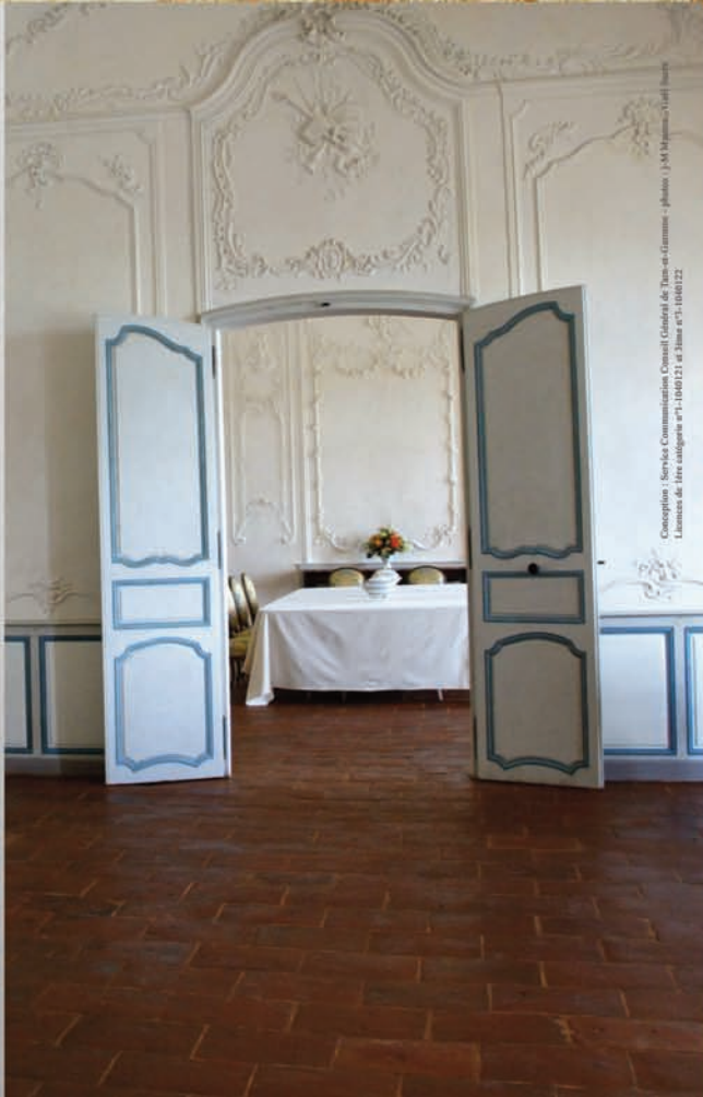
Conception : Services Communication Conseil Général de Tarn-et-Garonne - L'ensemble de l'ère médiévale n°1-1040121 et l'ère n°1-1040122